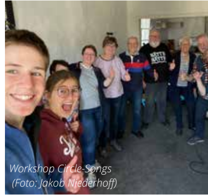
Workshop Circle-Songs