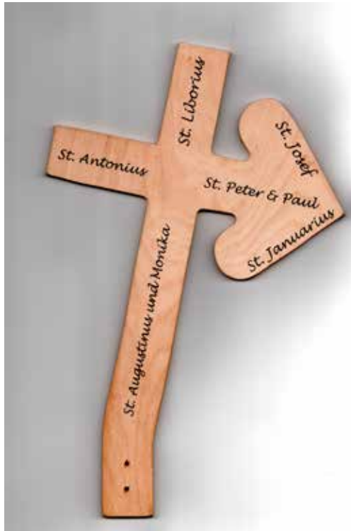
Logo: © Domkapitel Aachen; Pilgerkreuz Gestaltung: Hanna Johannes & B. Jacobi

Unser Pilgerkreuz ist auch fertig, so dass wir im Zeichen des Kreuzes nach Aachen fahren.