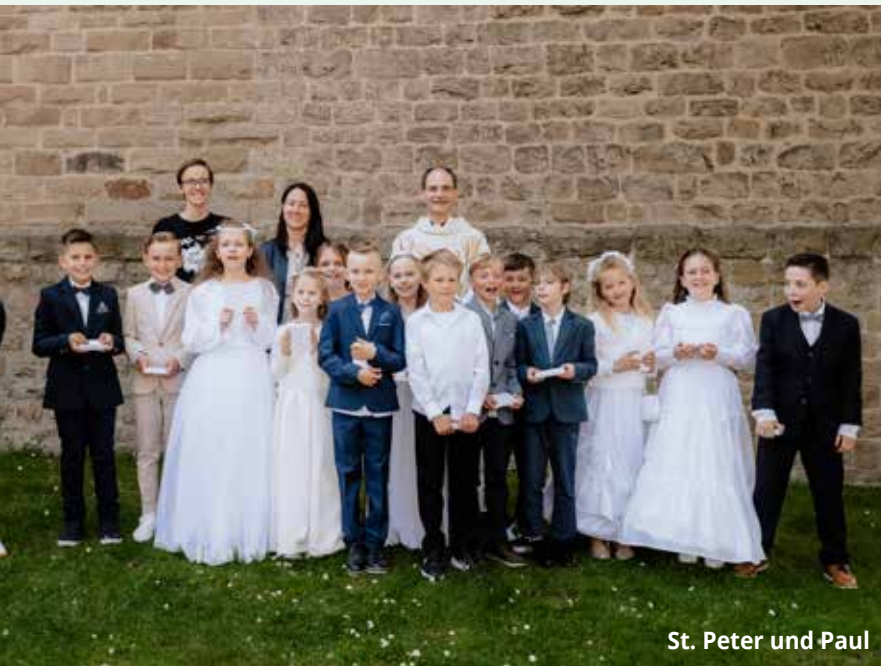
St. Peter und Paul