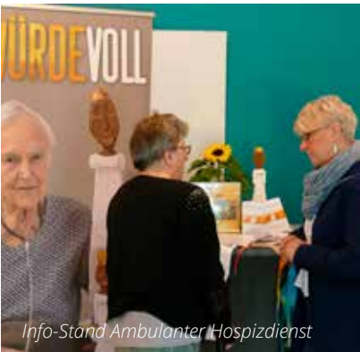
Info-Stand Ambulanter Hospizdienst