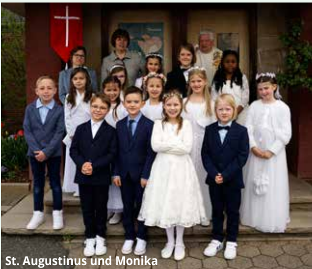
St. Augustinus und Monika

Wir gratulieren den Kommunionkindern zu ihrem Festtag und wünschen ihnen Gottes reichen Segen für den weiteren Weg. Unser Dank gilt den Katechetinnen und Katecheten für ihren verantwortungsvollen Dienst in der Vorbereitungszeit sowie allen, die durch ihr Mittun und Engagement zum Gelingen der Feiern beigetragen haben.