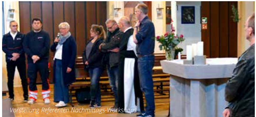
Vorstellung Referenten Nachmittags-Workshops