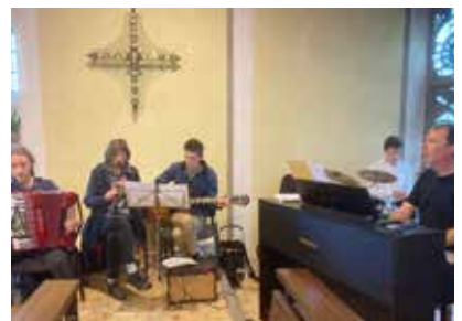
Band „Um Gottes Willen“