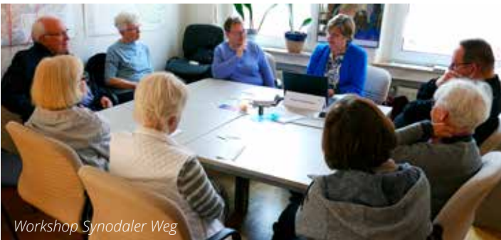
Workshop Synodaler Weg