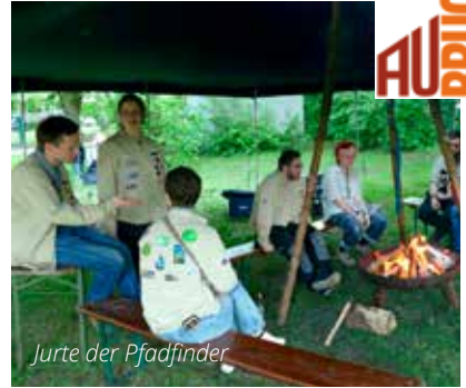
Jurte der Pfadfinder