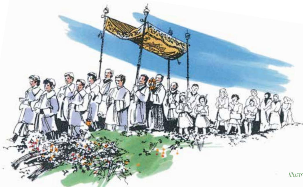
Illustration: Karl Knospe