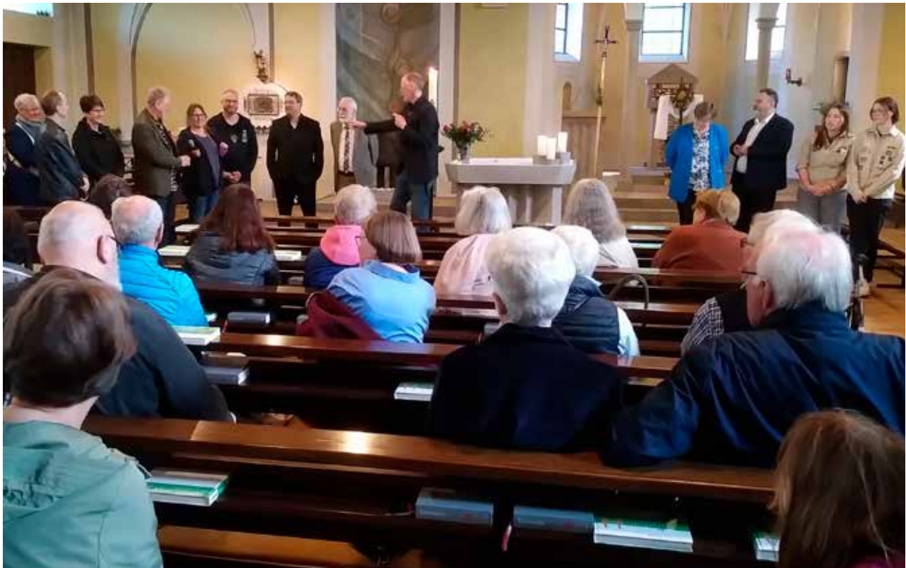
Auftakt in der Kirche